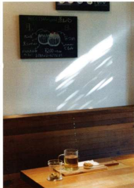
イラストレーション = 川上貴士 文 = 孫奈美